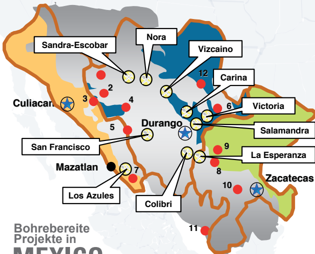
Bohrbereite Projekte in MEXICO