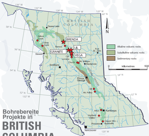
Bohrbereite Projekte in BRITISH COLUMBIA